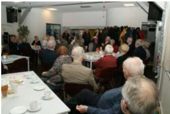
Oudejaarsborrel vrijdag 29 december 2017