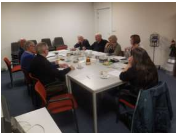
Coördinatorenoverleg woensdag 10 januari 2018