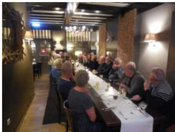
Dank aan de vrijwilligers maandag 15 januari 2018